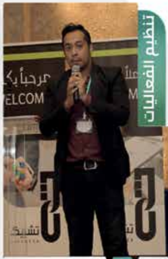
Event Management 04