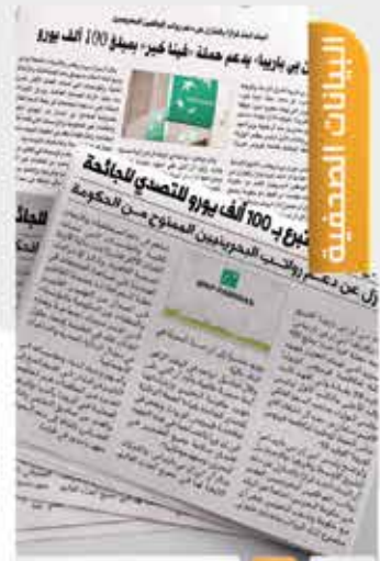
Press Releases 06