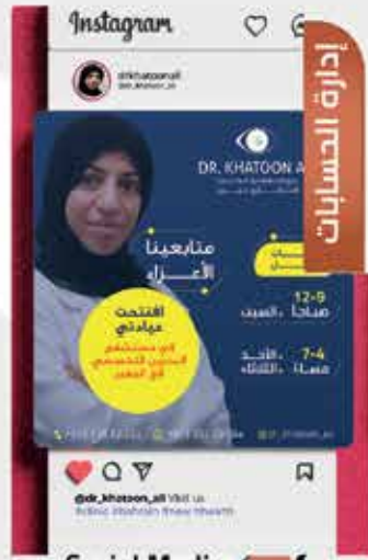
Social Media Management 05