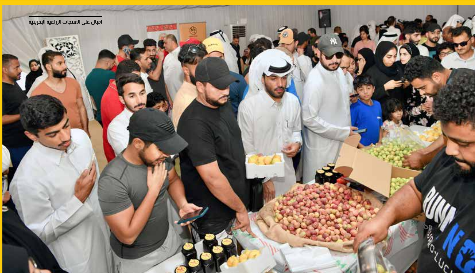
اقبال على المنتجات الزراعية البحرينية