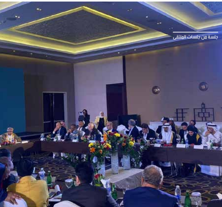
جلسة من جلسات الملتقى

انطلقت أعمال الدورة السابعة لملتقى الاتحادات العربية المتخصصة المنعقدة في مدينة صلالة بسلطنة عمان بتنظيم من الاتحاد العربي للإعلام السياحي وبرعاية من جامعة الدول العربية من الفترة 29 يوليو إلى 1 أغسطس برئاسة الوزير المفوض محمد خير عبدالقادر مدير إدارة المنظمات والاتحادات العربية وبحضور رؤساء وأمناء ومديري الاتحادات العربية النوعية المتخصصة وناقشت الدورة عدة محاور. جاء ذلك ضمن فعاليات الدورة السابعة لملتقى الاتحادات العربية النوعية المتخصصة والمنتدى العربي الثالث للسياحة والتراث وحفل (أوسكار الإعلام السياحي 2023) بتنظيم من الاتحاد العربي للإعلام السياحي وبمشاركة كويتية ورعاية من جامعة الدول العربية. الملتقى تزامن مع فعاليات مهرجان خريف ظفار والذي يحظى بتغطية إعلامية كبيرة تتمثل في حضور نحو 120 إعلامياً وصحفيًا وناشطًا اجتماعيًا يمثلون كبريات المؤسسات الإعلامية في الوطن العربي. وشهد الملتقى حصول رئيس معهد الشارقة للتراث د. عبد العزيز المسلم على لقب «شخصية التراث العربي لعام 2023» وإقامة حفل أوسكار الإعلام السياحي العربي لتكريم الفائزين المبدعين من مختلف أرجاء الوطن العربي. وعقد الملتقى الذي يهدف للترويج للمقومات السياحية العربية برعاية محافظ ظفار مروان بن تركي آل سعيد.