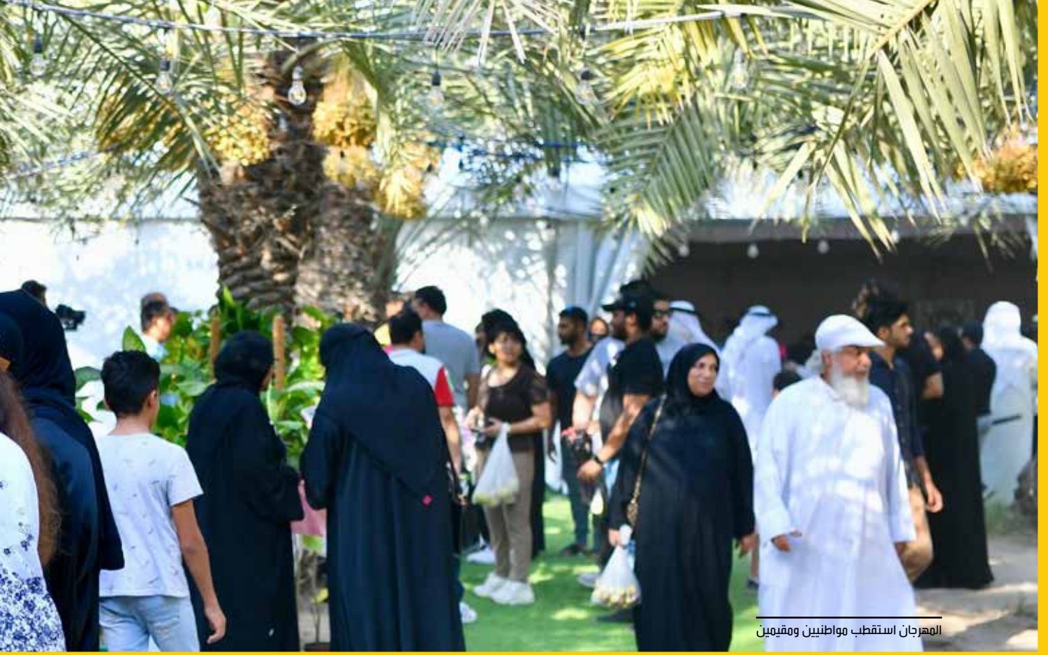
المهرجان استقطب مواطنين ومقيمين

وشهد المهرجان حضوراً جماهيرياً كبيراً في أسبوعه الثاني والأخير ومشاركة 18 مزرعة و3 مشاريع وأسر منتجة، و11 مطعمًا متخصصًا في منتجات اللوز، وعدداً من الفعاليات المتنوعة التي تضمنت عرض أصناف شتلات اللوز، وعرض أصناف ثمار اللوز، وفعاليات للأطفال. من جهتها أكدت الأمين العام للمبادرة الوطنية لتنمية القطاع الزراعي الشيخة مرام بنت عيسى آل خليفة أن مثل هذه المهرجانات تعتبر فرصة مهمة لتبادل