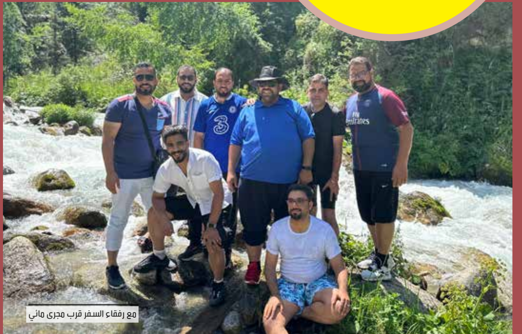
مع رفقاء السفر قرب مجرى ماني

إيسك كول والتي تعني البحيرة الدافئة وهي عبارة عن حوض جبلي مغلق يقع بالقرب من جبال تيان شان شمالي شرقي قيرغيزستان. وتعد سابع أعرق بحيرة في العالم، وعاشر أكبر بحيرة في العالم من حيث الحجم وثاني أكبر بحيرة مالحة بعد بحر قزوين. والطريف في هذه البحيرة رغم أنها محاطة بقمم مغطاة بالثلوج، إلا أنها لا تتجمد أبدًا. ونحن نتجول على ضفاف البحيرة رأيت مشهداً من التاريخ لرجل يرتدي ملابس من عصور مضت يحتضن امرأة تلبس ملابس من ذات الحقبة، ورأيت بالقرب منهم كاميرا تلفزيونية تصورهم فاستنتجت أنهم يصورون مشهداً تمثيلاً وقلت لإياد: «لا تفوت هذه اللقطة».