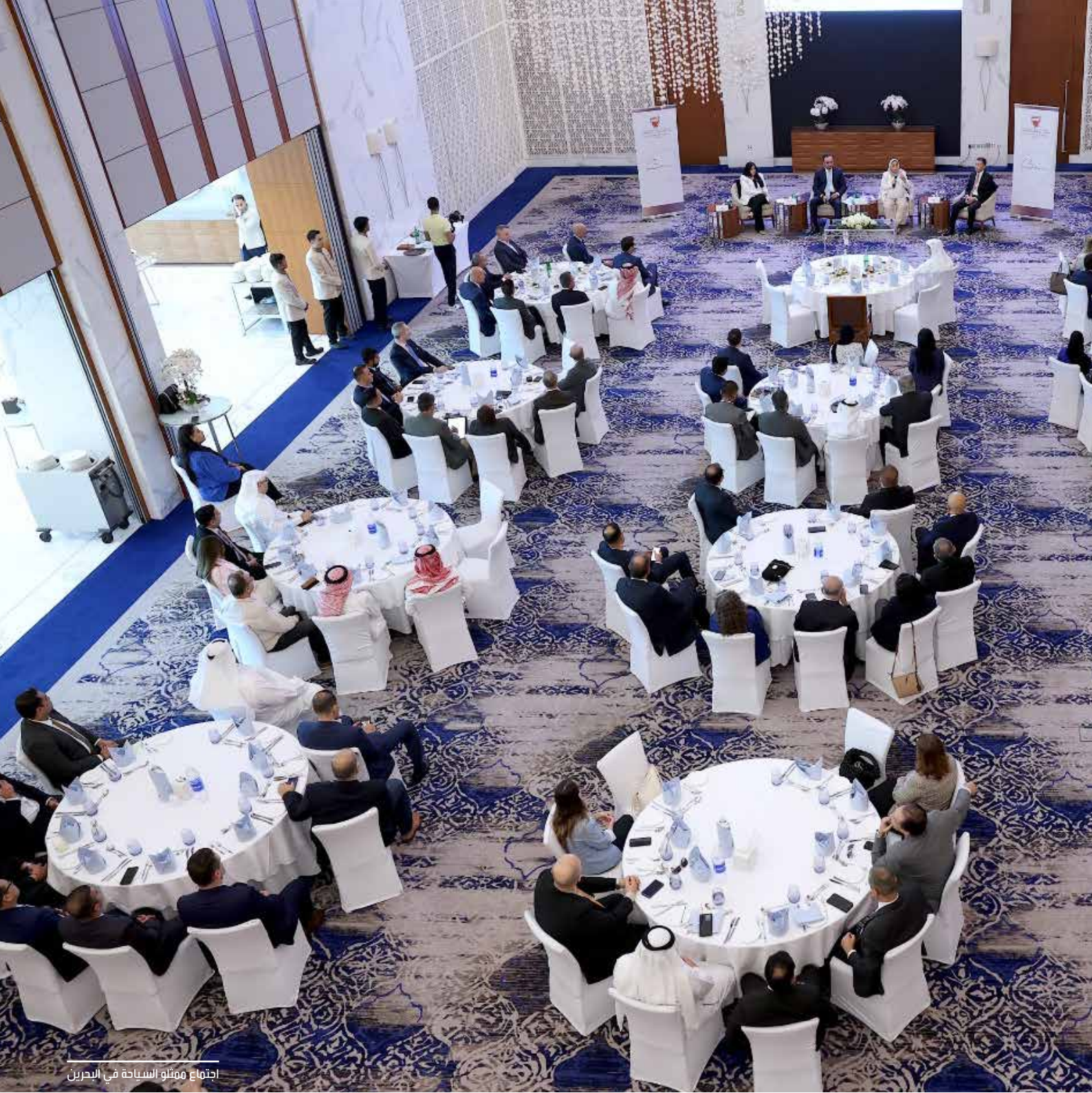
اجتماع ممثلو السياحة في البحرين

بوضع البحرين ضمن قائمة عدة مدن سياحية في المنطقة، بحيث تكون البحرين جزءاً أساسياً من البرنامج السياحي لأولئك السياح الذين يمضون إجازتهم في أكثر من دولة ومدينة بالمنطقة، وأوضح أنه من المقرر أن تبدأ هذه المرحلة في الربع الأول من العام 2024. يذكر أن المجتمعون استمعوا لعرض للخطط الاستراتيجية لتطوير الشراكات القائمة بين الهيئة والشركاء الرئيسيين في قطاع السياحة، وشددت الهيئة التزامها على تقديم كافة أشكال الدعم والمساندة اللازمة لشركائها والتي تشمل تسهيل إصدار التراخيص والتأشيرات السياحية، وتطوير خطط تسويق شاملة للترويج للباقات السياحية، وتطوير مسارات الرحلات بالتعاون مع شركات إدارة الوجهات والفنادق.