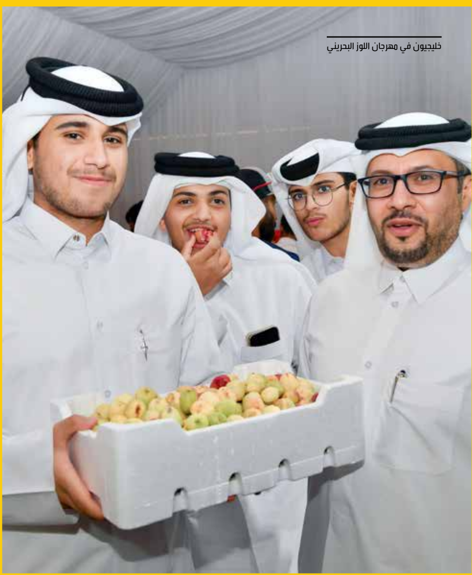
خليجون في مهرجان اللوز البحريني

الخبرات والتجارب والعمل على زيادة الإنتاج وتحقيق الأهداف الزراعية في مملكة البحرين، كما أنه منصة توعوية من خلالها نستطيع توعية الجمهور بالثمار البحرينية وكيفية رعايتها والإستفادة منها بالصورة الأمثل.