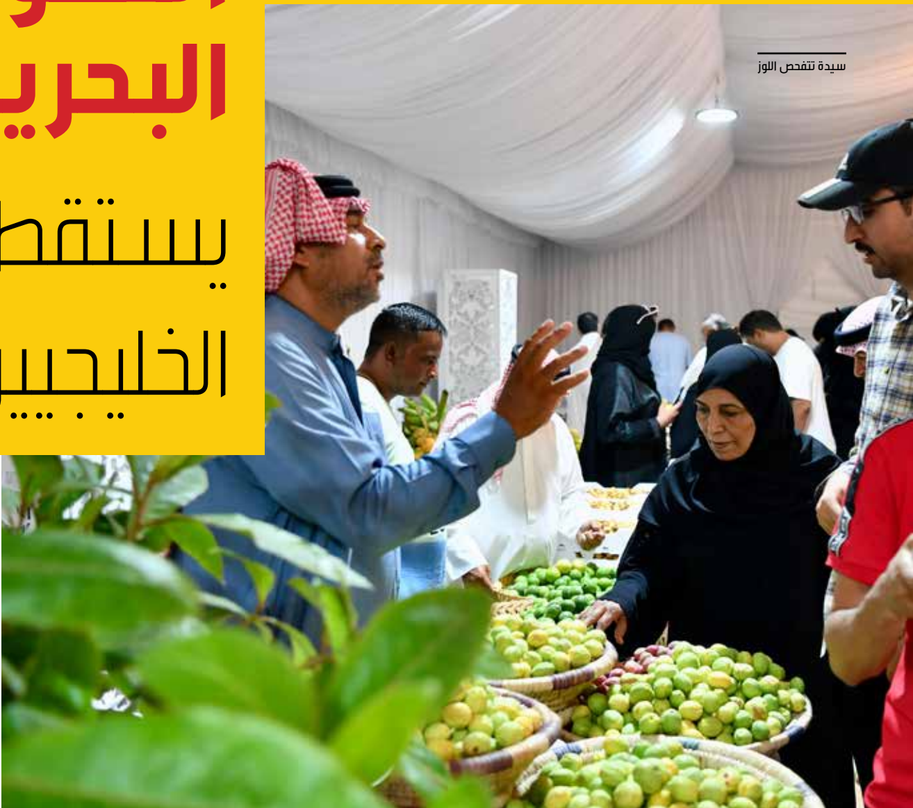
سيدة تتفحص اللوز