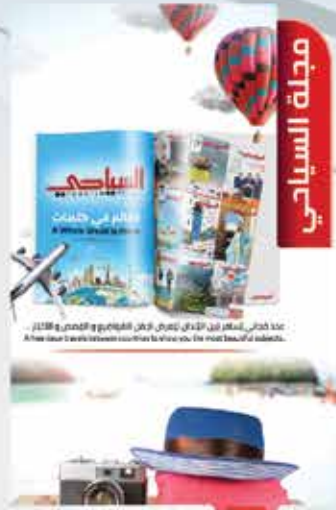
Tourism Magazine 02