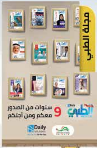
Medical Magazine 01