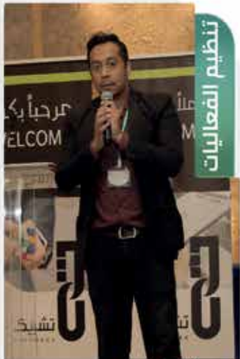
Event Management 04