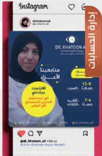
Social Media Management 05