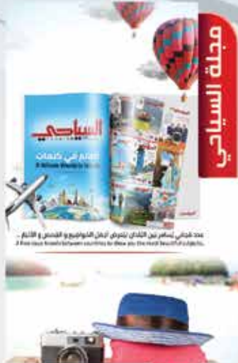
Tourism Magazine 02