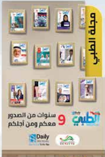
Medical Magazine 01