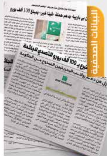
Press Releases 06